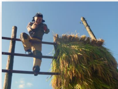
はさがけ(中ノ俣の天日干し)