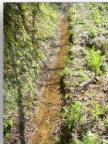
用水は多様な生き物も棲む