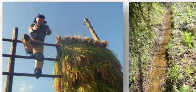
はさがけ(中ノ俣の天日干し)

（関東甲信越の場合940円/10kg、2,070円/30kg 燃料の高騰により送料も値上がりしました。ご了承下さい）