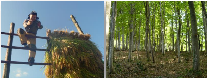
はさがけ(中ノ俣の天日干し)

中ノ俣産米（はさがけ米）は、生産者の減少により生産量が著しく減少しています。誠に申し訳ございませんが、 お届け先1件につきご注文を30kgまで とさせていただきます。