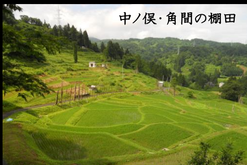
中ノ俣・角間の棚田

有縁の米は、都市とムラの支え合いの仕組みです。 有縁の米は、田んぼも水も森も作り手も、みんなきちんとわかります。