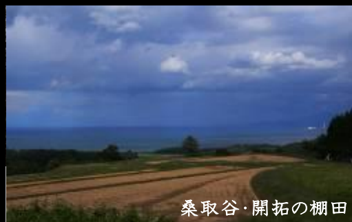
桑取谷・開拓の棚田